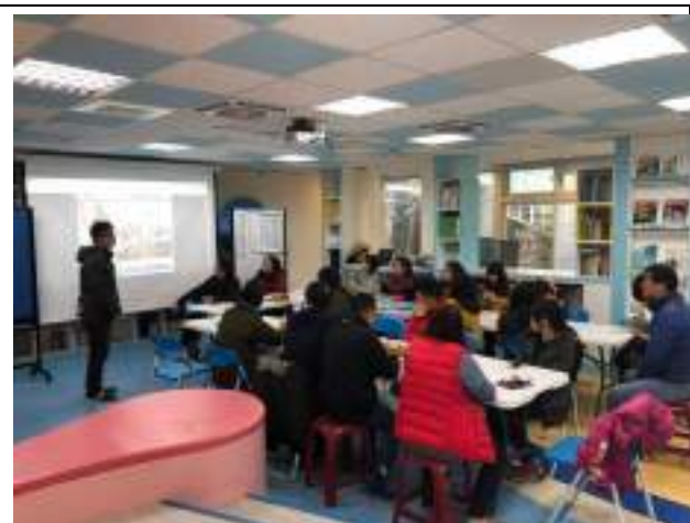
家庭教育通報分享