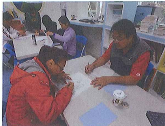
版畫課教師研習-全校教師一起學習版畫基本功