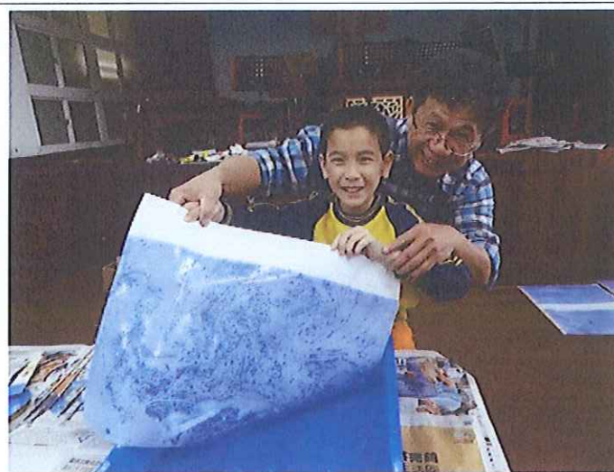
引進專業有熱忱的師資，讓藝術的種子在師生的心中萌發。