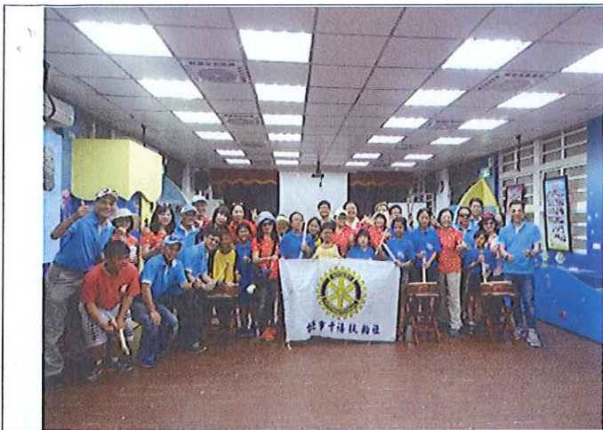
適時向外賓展現打擊樂學習成果