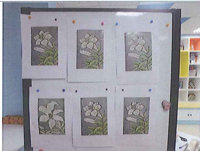
教師學習版畫成果，師生各一位榮獲中華民國版畫學會全國師生迷你版畫創作比賽佳作。