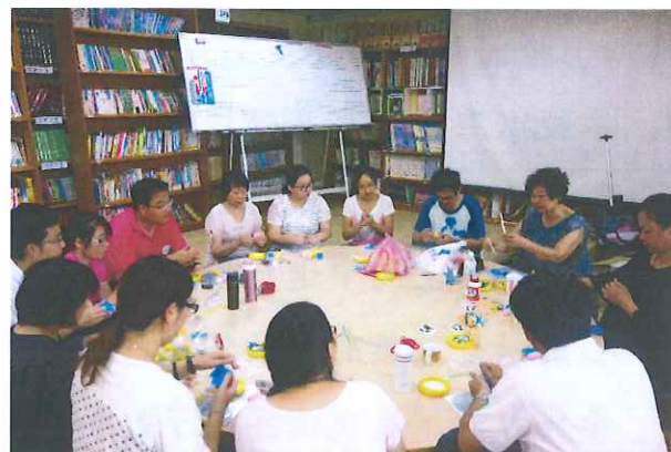
捏塑課教師研習-全校教師一起學習捏塑基本功