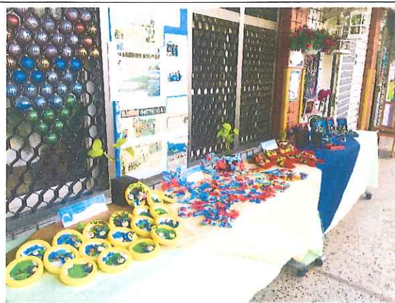
於校慶和期末成果發表會進行師生作品展示。 並提供布置於瑞芳區地政事務所，進行展覽。