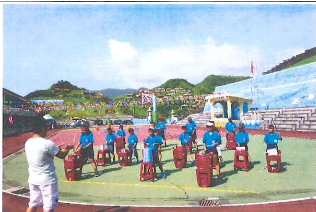
全校學生校慶打擊樂演出，大獲好評。 獲得善心人士捐贈全校學生一批打擊樂器。