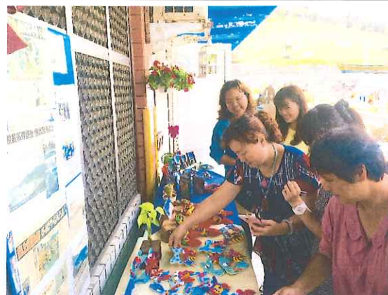
105 年 6 月 16 日委員到校進行訪視