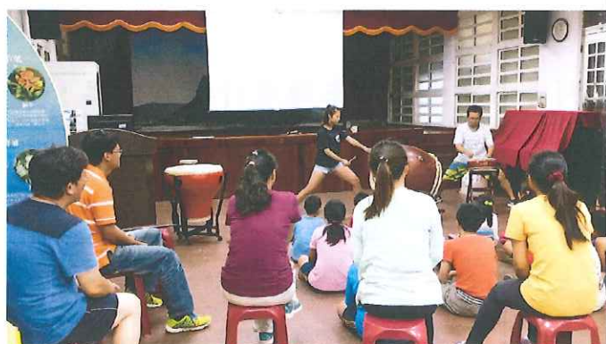
打擊樂教師研習-認識各種打擊技巧與演出方式